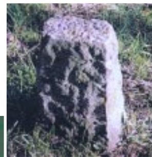
Bigarren plaza. XIX. mendearen lehenengo erdialdekoa Segunda Plaza, primera mitad del siglo XIX